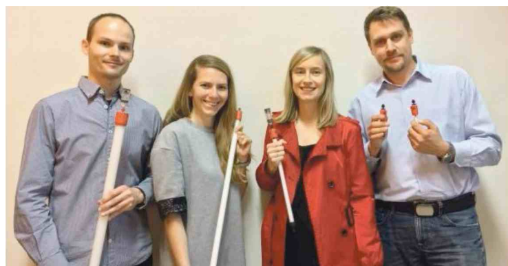
Avtorji drugonagrajene najinovacije s fakultete za farmacijo