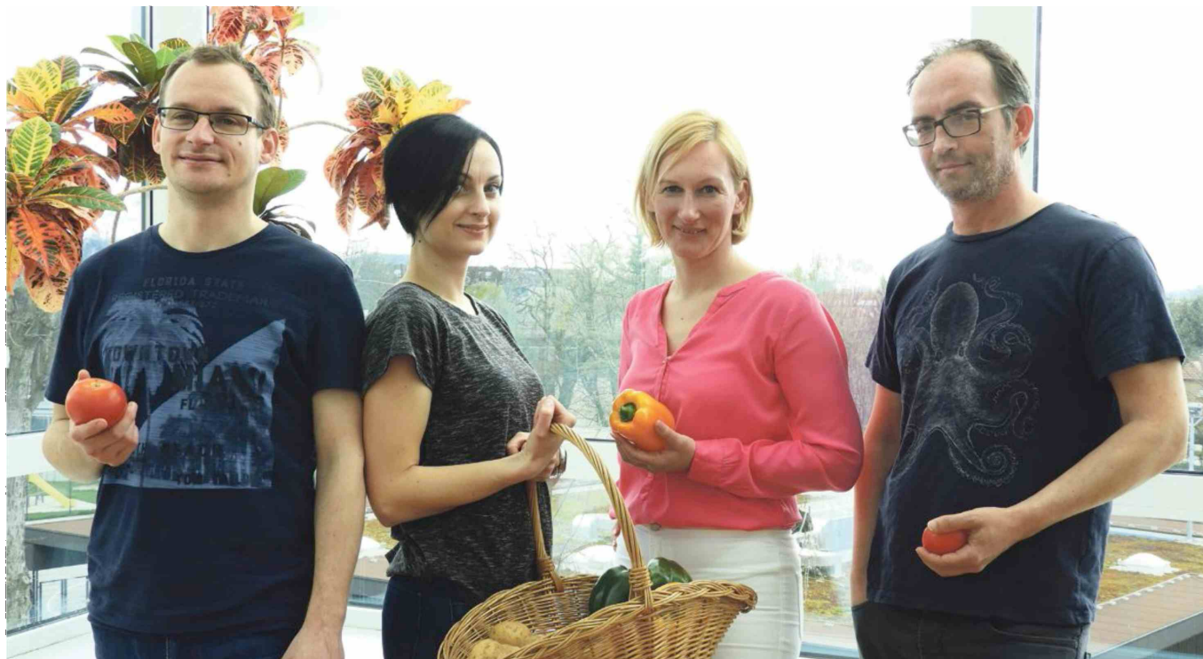
Del zmagovalne ekipe, ki je zasnovala letošnja najinovacijo, nov pristop za zaščito kulturnih rastlin.